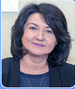
Dorota Pędziwiatr Starosta Belchatowski