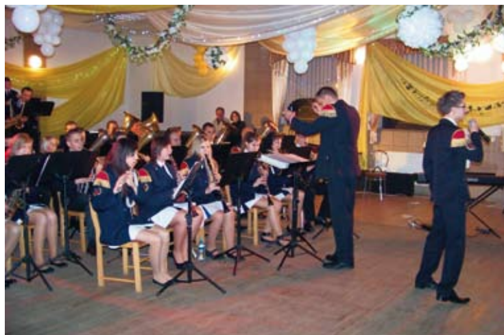
Przed szczercowską publicznością wystąpiły wszystkie trzy orkiestry dęte działające na terenie gminy.

Cieszy fakt, iż co roku impreza przyciąga coraz więcej słuchaczy. Dom Kultury „Strażaka”, w którym odbył się Wieczór Muzyczny pękał w szwach! Zainteresowanie ze strony mieszkańców tegoroczną edycją imprezy przeszło najśmielsze oczekiwania organizatorów.