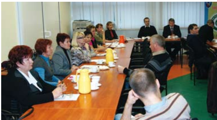
W konsultacjach nt. Programu współpracy z organizacjami pozarządowymi brali udział sami zainteresowani.

- organizacja i wdrażanie amatorskich oraz profesjonalnych projektów i programów obejmujących różne obszary kultury, w tym warsztaty artystyczne i edukację kulturalną.