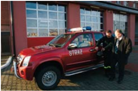
Terenowe Isuzu wraz z wyposażeniem kosztowało 160 tysięcy złotych.

O czerwony, ale przede wszystkim nowoczesny, terenowy samochód operacyjny Isuzu wraz z wyposażeniem wzbogaciła się Komenda Powiatowa Straży