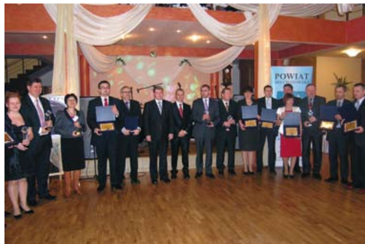
Gala laureatów ostatniej edycji konkursu „Firma na medal”, luty 2010.