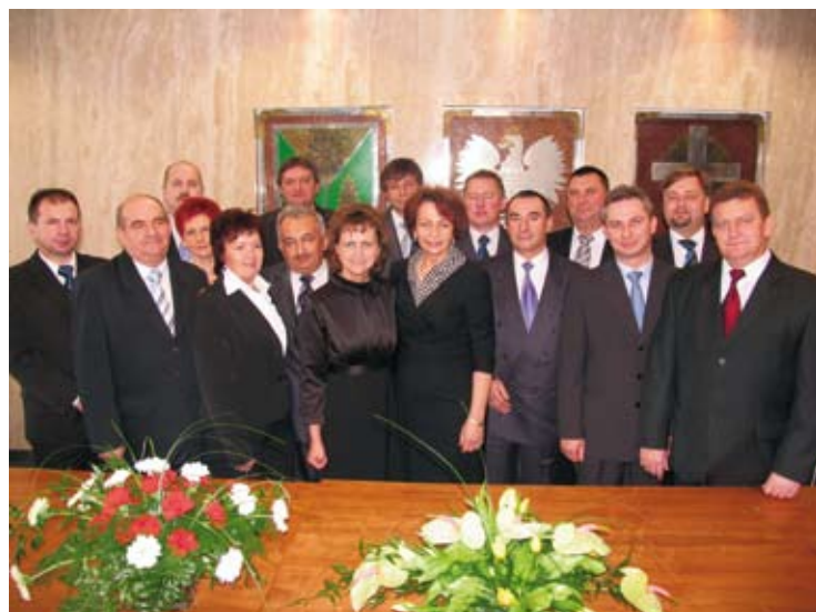
Wójt Gminy Kleszczów oraz radni wybrani na nową kadencję.

Mieszkańcom Powiatu Bełchatowskiego życzymy miłych, spokojnych i pełnych nadziei Świąt Bożego Narodzenia oraz wielu dobrych chwil spędzonych w gronie najbliższych. W Nowym Roku 2011 życzymy dobrego zdrowia oraz wszelkiej pomyślności