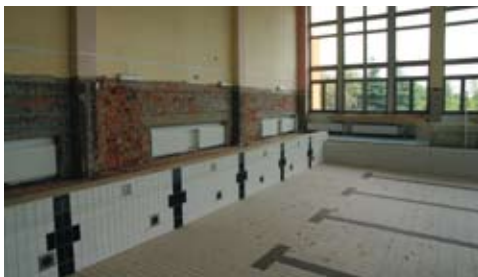
Basen w trakcie remontu. Wymieniono m.in. płytki, fugi, powstały nowe posadzki i odnowiono trybuny.

Po kilku miesiącach remontu zmodernizowany basen przy Zespole Szkół Ponadgimnazjalnych nr 3 w Bełchatowie gwarantuje komfort i bezpieczeństwo pływania. Przypomnijmy, iż kolejny etap remontu części sportowej szkoły rozpoczął się jeszcze w wakacje. Modernizacji została poddana część basenowa wraz z zapleczem. Firma, która wygrała przetarg otrzymała za wykonane prace ponad 827 tysięcy złotych . Remont objął modernizację sali basenu oraz zaplecza sanitarnego. Sala basenowa ma teraz nowe płytki na ścianach i odnowione fugi w płytkach basenowych. Powstały także nowe posadzki i odnowiono trybuny. Z kolei w części zaplecza wszystkie pomieszczenia zostały poddane gruntownej przebudowie począwszy od wymiany przewodów elektrycznych, poprzez nowe glazury, aż po wymianę drzwi. Ponadto wymienione zostały wszystkie okna w sali basenowej.