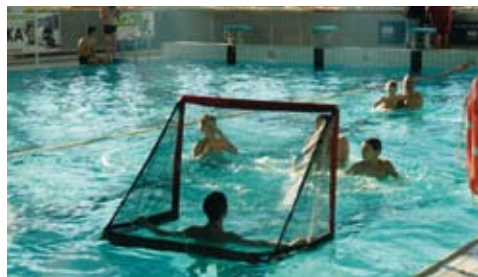
Pływanie w odnowionym basenie to teraz wielka przyjemność.