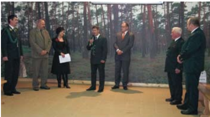
Podsumowanie konkursu w Izbie Edukacji Ekologicznej w Szkółce Leśnej „Borowiny”.