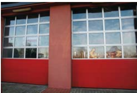
Wymiana bram garażowych w KP PSP była jednym z najważniejszych przedsięwzięć w roku 2010.

Pożarnej w Bełchatowie. Auto warte 160 tysięcy złotych zostało zakupione ze środków budżetu powiatu przeznaczonych, najogólniej mówiąc, na ochronę środowiska, nazywanych także „zielonymi pieniędzmi”. W skład wyposażenia Isuzu wchodzi aparat powietrzny z maską i butlą, detektor wielogazowy, zestaw medyczny oraz radiotelefony. Terenówka ta zastąpi wyśłużoną 14-letnią Ładę Nivę.