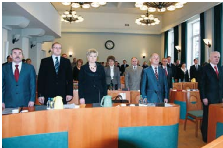
I sesję IV kadencji samorządu powiatowego zainaugurowało złożenie przez radnych ślubowania.

mnie najważniejsi są ludzie, współpraca gospodarcza i rozwój powiatu oraz jego wszystkich gmin.